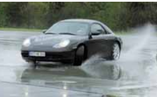
Die Teilnehmerinnen lernten die Fahrphysik unter erschweren Bedingungen kennen und – hatten Spaß dabei!