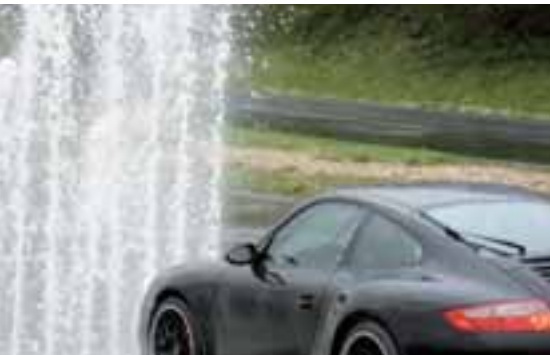
Schrecksekunde vor der Wasserwand.