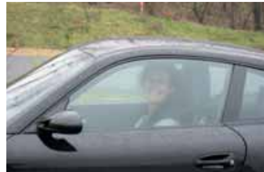
Glücksgefühle hinterm Lenkrad.