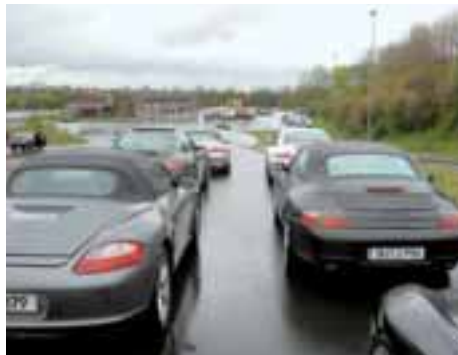
Vor dem Start: die Teilnehmerfahrzeuge in Reih und Glied.