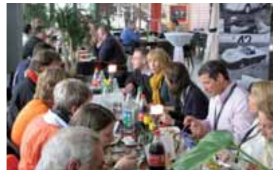
Stärkung muss sein.